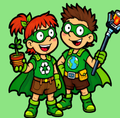
Foglio-LINA & Capitan Riciclo