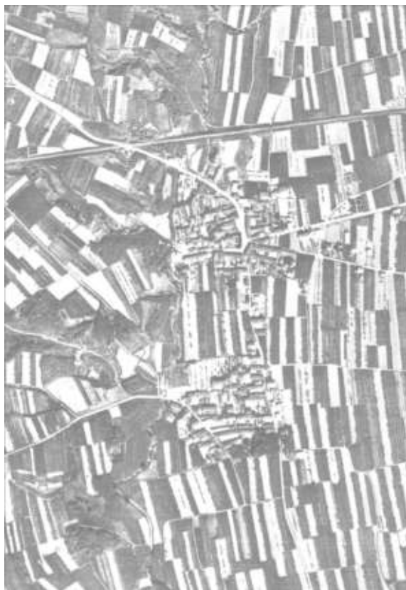
Terno d'Isola, volo GAI 1954