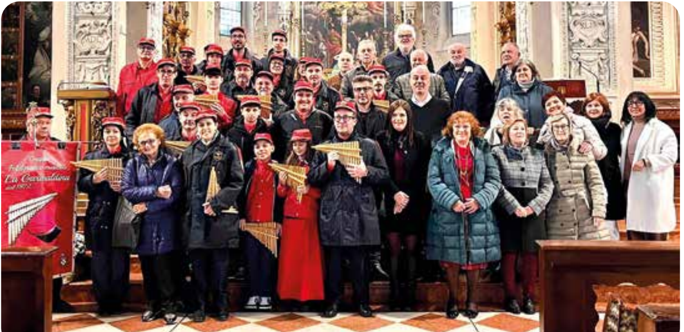
Garibaldina e Corale nei festeggiamenti di Santa Cecilia

E ancora, laboratori di Halloween e per il Natale , per scatenare la creatività e trascorrere qualche ora insieme.