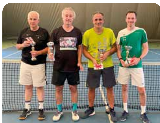
Premiazione torneo permanente invernale doppio maschile 2023/24