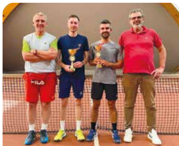
Premiazioni torneo permanente invernale singolare maschile 2023/24

Cogliamo con piacere l'occasione per ringraziare lo staff della Fortennis, che collabora con passione alla gestione degli appuntamenti sportivi, oltre che alla gestione ordinaria delle attività. Un doveroso ringraziamento va anche ai nostri sponsor, senza i quali non sarebbe possibile organizzare i tornei più impegnativi dal punto di vista economico: Assigeco, Carm.Impianti, Fer.vi 2002, Filago Inox, Mete Srl, CM3.