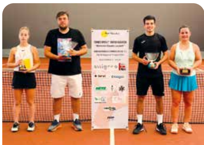
Premiazioni torneo FITP 2ª cat. OPEN Maschile e femminile 2024