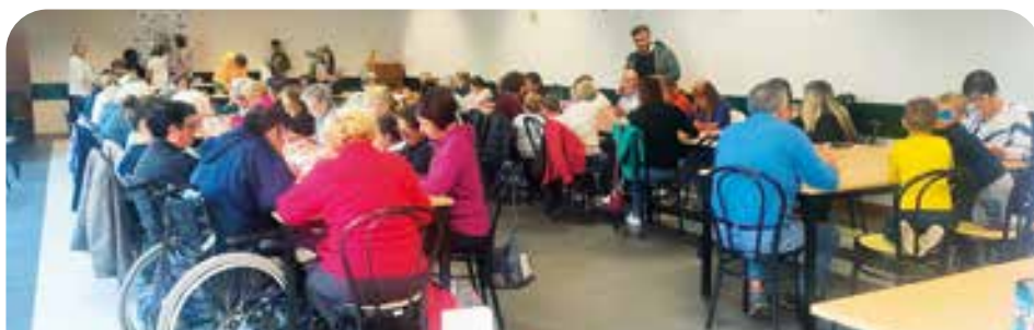
Festa dei nonni

Prima di continuare a narrarvi della progettualità dei miei Servizi, vorrei portare l'at-