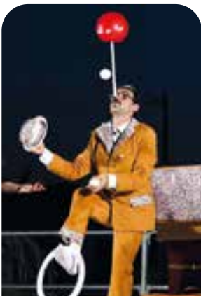
Teatro per bambini

Per non perdervi tutto questo, e molto altro ancora, vi invito a seguire il sito istituzionale, i canali social, e l'App comunale dove verranno pubblicati i dettagli di ogni evento. Quello che più conta è esserci!