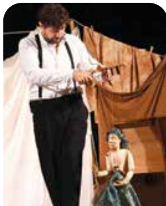
Monologo Mille e una notte