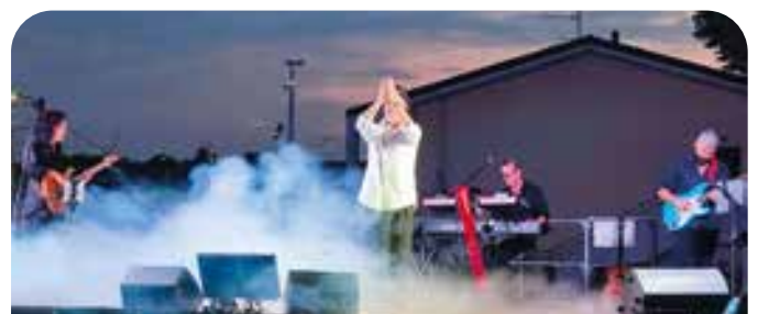
Concerto tributo Renato Zero