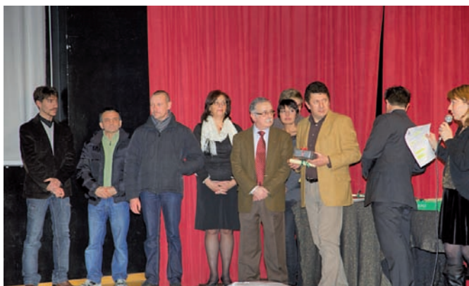
Serata della Premiazione del Concorso

Visto il successo del Concorso Fotografico dello scorso anno, si è ritenuto opportuno riproporlo, grazie alla collaborazione con l'Associazione Gru di Sadako. Il tema della seconda edizione è stato il seguente: "Tradizioni, Arti e Mestieri", che ha incluso folklore e gli usi e costumi anche locali. Su tali tematiche si sono espressi i fotografi partecipanti, evidenziando un certo talento che si ravvisa nelle fotografie esposte. Sono state premiate le tre fotografie giudicate migliori dalla commissione incaricata della decisione: