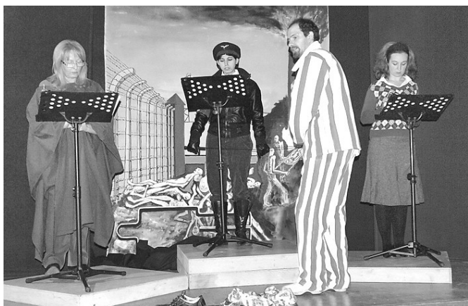
Un punto di alta drammaticità della pièce

G li appuntamenti che vedono impegnata la nostra compagnia continuano ad essere molti, infatti abbiamo cominciato il nuovo anno a Sotto il Monte, (il 28 gennaio) con la rappresentazione di "Sonderkommando" di Shlomo Venezia in occasione della Giornata della Memoria. Al di là dei sentiti complimenti