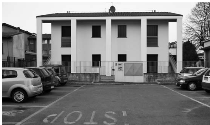
La palazzina di via dei Partigiani

loggi, i cui requisiti sono stati redatti in stretta collaborazione con il personale dei servizi sociali, che più di tutti ha il polso della situazione ternese, sono state agevolate le situazioni di maggior disagio sociale e abitativo, tenendo conto anche della presenza nel nucleo familiare di persone affette da disabilità o che sono inabili al lavoro.