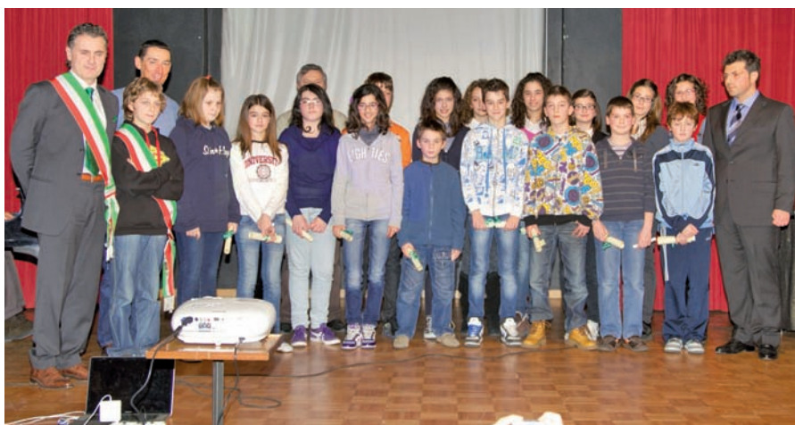
Consegna delle Borse di Studio agli Studenti della Classe V di Primo grado