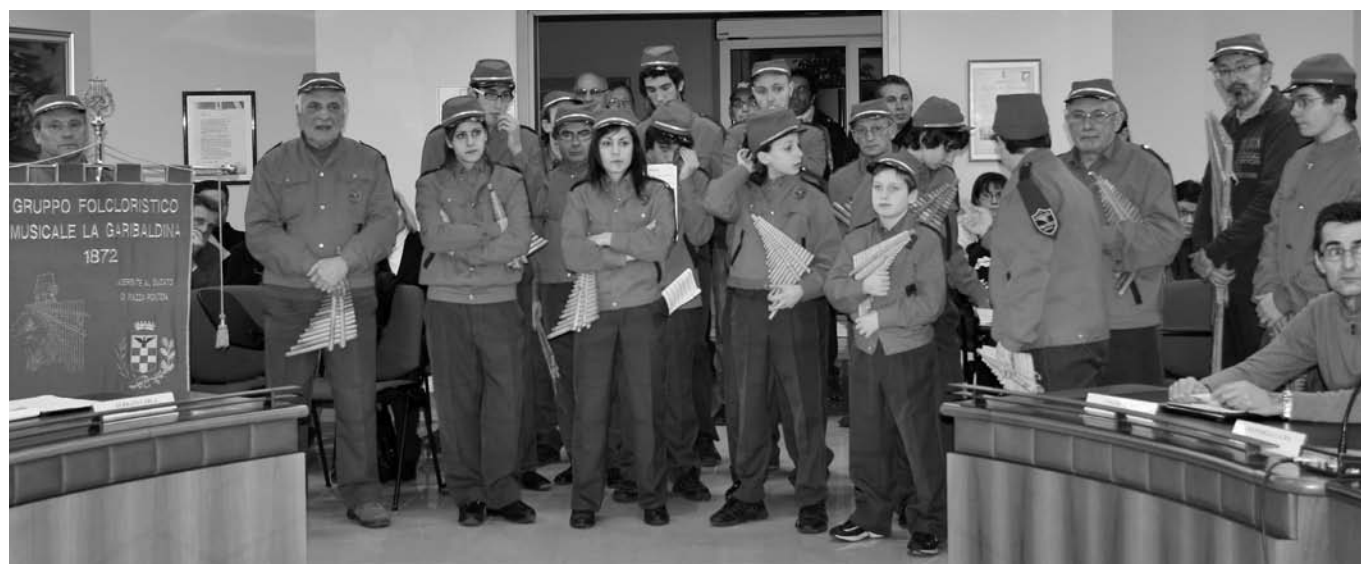
Il gruppo della Garibaldina nella Sala Consiliare