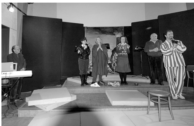
e... tutti in scena