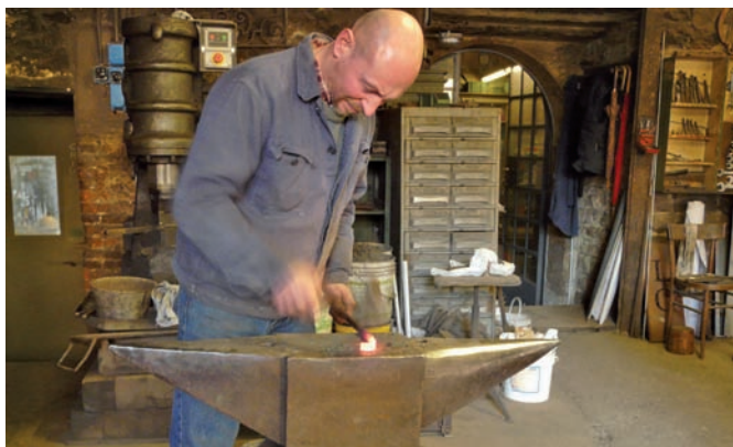
Secondo Premio: Il Forgiatore , di Michela Leidi