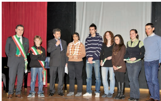
Borse di Studio agli Studenti della Classe V scuola Secondaria di II grado