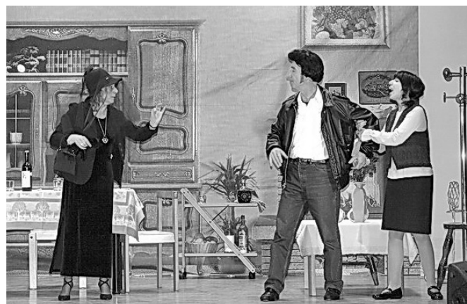
I primi scambi di opinioni...