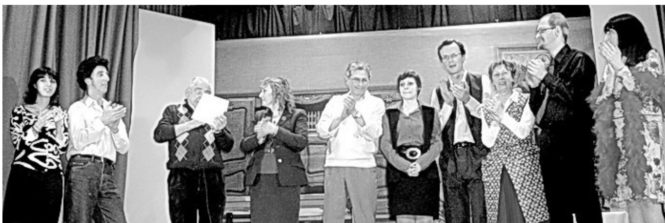
E il finale...

Le rappresentazioni del 12 marzo a Chiuduno ed il 19 marzo a Chignolo d'Isola per la Rassegna Teatrale annuale sono state effettuate in corso di stampa dell'Informaterno, ed il 26 marzo saremo nell'Auditorium comunale a Terno d'Isola.