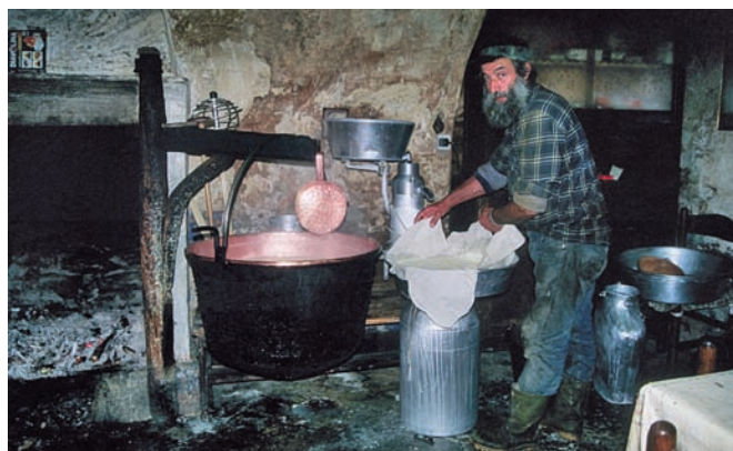
Primo Premio: Arte Casearia , di Renato Aldo Ferri