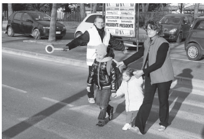
Attraversamento alle scuole

A inizio anno scolastico, in accordo con l'Assessore alla Pubblica Istruzione e la Polizia Locale, l'attenzione dell'A.V.A.P. si è concen-