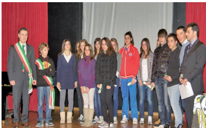
Borse di Studio agli Studenti della Classe III scuola Secondaria di I grado

L'Amministrazione comunale ringrazia per questo gesto, degno di esempio.