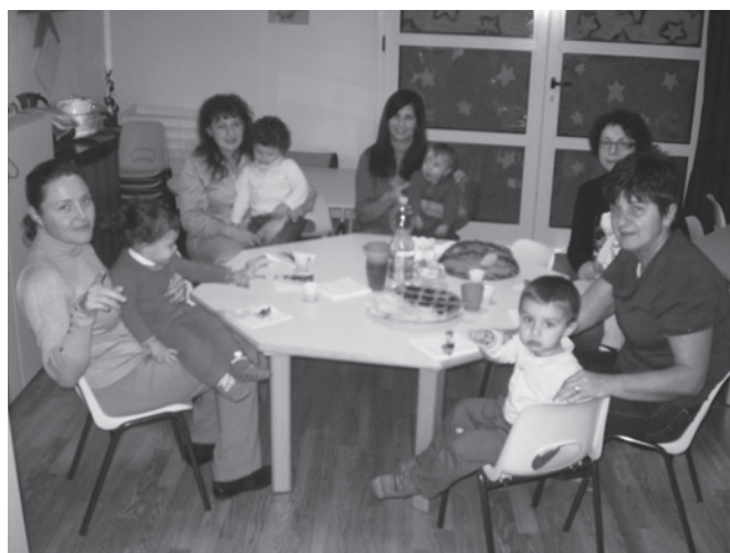
Alcune mamme e nonne con i loro bambini durante il momento della merenda!

Associazione "Le Gru Di Sadako" Via Bravi, 16 – 24030 TERNO D'ISOLA (BG) Tel & Fax: 035.90.50.08 – e-mail: grudisdako@virgilio.it Mar. 9-11 – Merc. 20-22 – Giov. 17-19