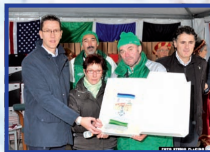
Pag 38: Teremotata 2010