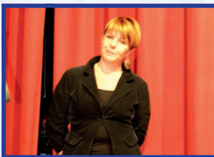
Pag 36: Suoni e Colori a Terno d'Isola