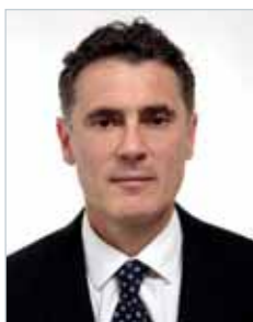
Corrado Centurelli, Sindaco