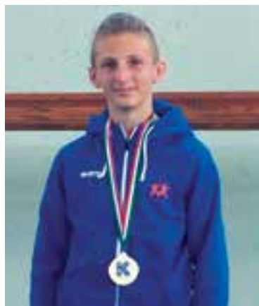
Il nostro campione Lombardo di karate

per tutto l'anno la disciplina del karate ai ragazzi di 1 a , 2 a , 3 a , 4 a e 5 a elementare della scuola comunale di Solza. L'esperienza si è conclusa con un saggio finale che ha visto i ragazzi mostrare ai genitori ciò che