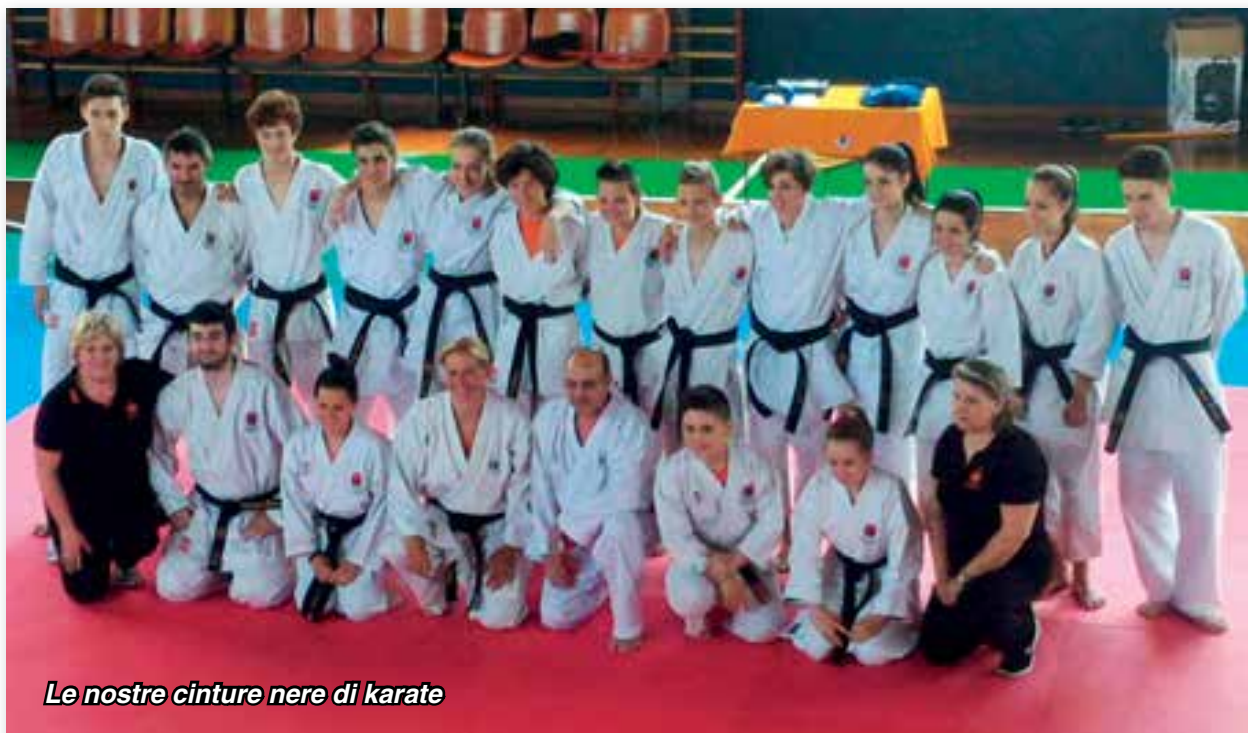
Le nostre cinture nere di karate

il 5° posto; ottimo risultato considerando la portata dell'evento.