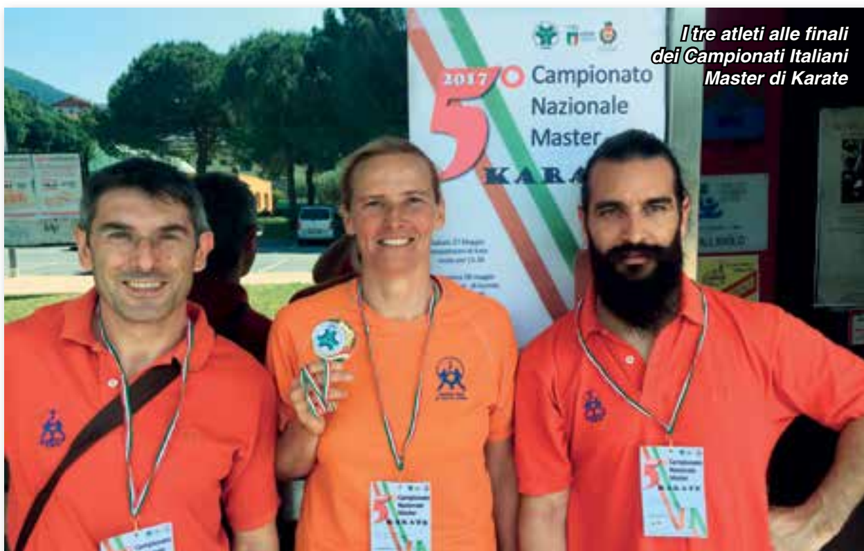
Il tre atleti alle finali dei Campionati Italiani Master di Karate